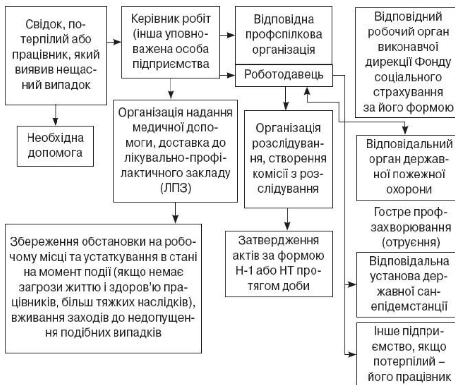
Рис. 1. Схема повідомлення про нещасний випадок та структура організації розслідування

На підприємствах, де немає структурних підрозділів, до складу комісії включається представник роботодавця.