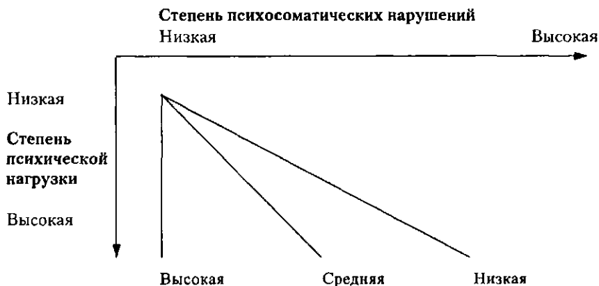
Рис. 20.3. Соотношение между социальной поддержкой, степенью психической нагрузки и психосоматических нарушений (House & Wells, 1978).

Проблематика социальной поддержки в течение многих лет находится в центре внимания исследований психической нагрузки, стратегий преодоления стресса. Многочисленные исследования показывают взаимозависимость между степенью психической нагрузки, подверженностью психосоматическим заболеваниям и мерой социальной поддержки (рис. 20.3).